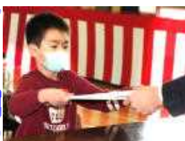
【修了証を受け取る1年代表児童】

3月20日(月)に、今年度の修了式を行いました。短い練習時間でしたが、各学年の代表児童は元気に返事をして、しっかりとした所作で学年全員分の修了証を受け取りました。壇上で見ていてとても頼もしく感じました。私の方からは、この1年間の成長に自信をもち、四月からの新しい出会いを大切にしたいことを一枚の書を紹介しながらお話ししました。