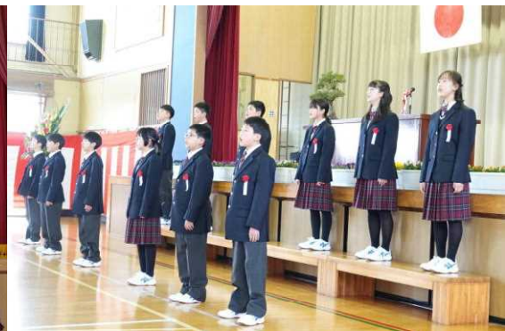
卒業生の合唱「翼をください」