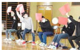
【アンケートクイズ】

卒業式を目前に控えた3月上旬、5年生が企画した6年生を送る会が開かれました。6年生一人一人がパフォーマンス入場して会場を盛り上げ、思い出スライドショーと突撃クイズで6年間を振り返りました。在校生からの出し物では、2年生と一緒にバンブーダンスをし、3・4年生からのアンケートクイズに答えて楽しみ