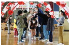
【花のアーチをくぐって】

ました。児童会の引継も行われ、6年生からは在校生へバトンタッチの寸劇が披露されました。1年生からは大きな声で6年生一人一人に激励の応援をしてもらい、その後みんなでマイ・バラードを歌いました。最後に6年生がくす玉の下に集まってひもを引くと、くす玉が見事に綺麗に開いて「未来へ向かって進め！」という垂れ幕が下がり、紙吹雪が舞って歓声が上がりました。6年生も気持ちよく楽しい時間を過ごすことができました。各学年、そして企画・運営を担当した5年生の頑張りが素晴らしいかったです。