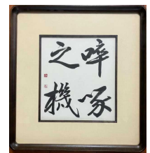
【初任のときの校長先生からいただいた書】

禅で、弟子が悟りを開くことができる段階に達したその瞬間に師匠が悟りのきっかけを与えることを、鳥の雛が卵から孵る場面にとえたもので、物事を成し遂げるための得がたいチャンス(=絶好の機会)のこととして使われます。私が初任のときの校長先生から教師の心構えとしてこの書をいただきました。4月は新しい出会いのときです。弘戸小学校の子どもたち一人一人がその出会いをチャンスとして、来年度また一回り成長することを期待しています。